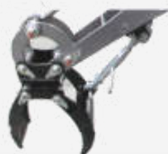
Rock Grabber RB60 € 295,-